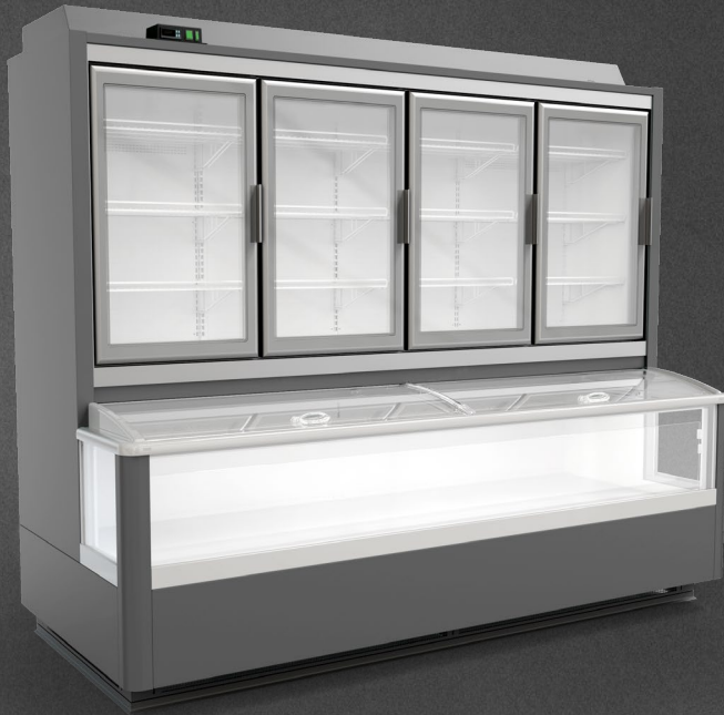
Mix MNMY-H2 2500 CCP