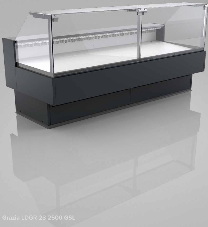
Grazia LDGR-28 2500 GSL

GSL – szymba | pojedyncza, prosta | podnoszona